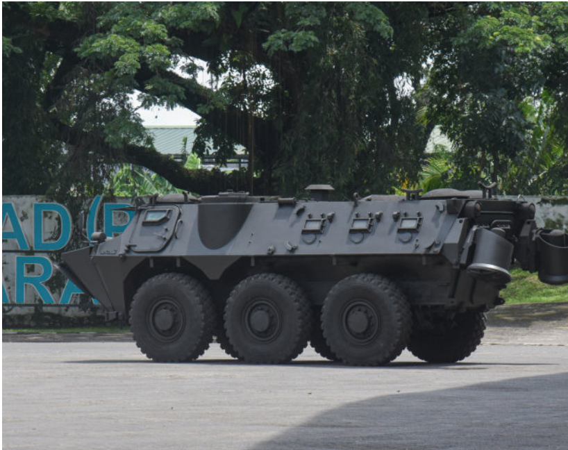
Dok. PT Pindad

PT Pindad bekerja sama dengan BRIN (Badan Riset dan Inovasi Nasional), PT Sigma Utama dan LPDP (Lembaga Pengelola Dana Pendidikan) meresmikan produk Cat Anti Deteksi Radar pada Selasa, 26 November 2024 berlokasi di PT Pindad, Bandung.