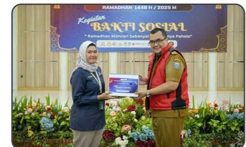
Tanggung Jawab Sosial & Lingkungan (TJSL) PT Pindad melaksanakan kegiatan bakti sosial dan menyerahkan 1.300 paket sembako untuk masyarakat sekitar lingkungan perusahaan. Kegiatan bakti sosial ini dilaksanakan pada Selasa, 25 Maret 2025 di Grha Pindad Bandung.