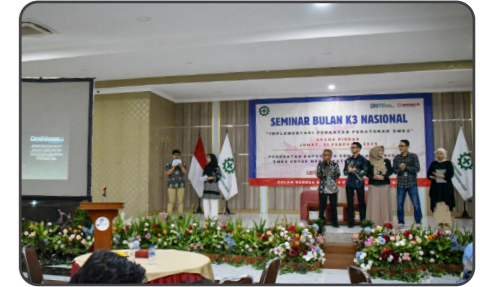
PT Pindad selenggarakan seminar bertajuk "Implementasi Penataan Peraturan SMK3" memperingati Bulan K3 Nasional Tahun 2025 yang diselenggarakan pada Jumat, 21 Februari 2025 berlokasi di Grha Pindad, Bandung.