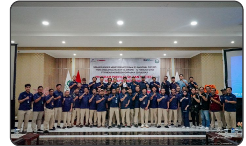
PT Pindad menyelenggarakan sosialisasi Program Profilaksis dan Proteksi Terhadap Risiko Bahaya pada Kamis, 30 Januari 2025 berlokasi di Grha PT Pindad. Sosialisasi Program ini dilaksanakan dalam rangka memperingati Bulan K3 Nasional Tahun 2025 serta bentuk kepedulian PT Pindad terhadap kesehatan pegawai terkhusus Divisi Produksi.