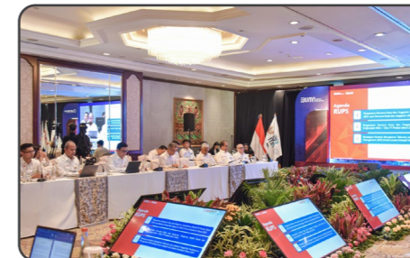
PT Pindad melaksanakan Rapat Umum Pemegang Saham (RUPS) pengesahan Rencana Kerja dan Anggaran Perusahaan (RKAP) 2024 bersama induk holding industri pertahanan DEFEND ID, PT Len Industri (Persero) serta anggota lainnya yakni PT DI, PT Dahana dan PT PAL Indonesia pada Kamis, 30 Januari 2025 di Shangri-La Hotel, Jakarta.