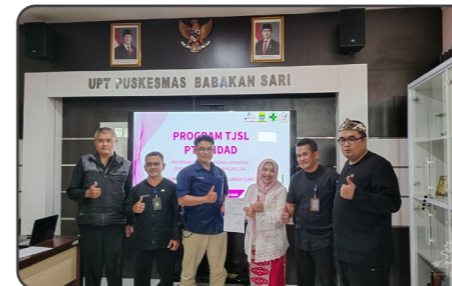
PT Pindad mendukung program pemerintah untuk penanganan Stunting dengan menyalurkan bantuan Pemberian Makanan Tambahan (PMT) kepada UPTD Puskesmas Babakan Sari Kecamatan Kiarasondong, Bandung pada Kamis, 30 Januari 2025.